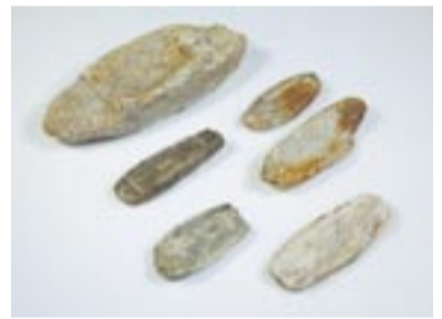
山頂から出土した舟形の形代

大島御嶽山遺跡では、甕(かめ)も多く出土していることから、酒や水なども甕に入れて山頂まで持つて行ったのかもしれない。酒や水を入れて山頂まで運ぶ労力も大きかったことでしょう。