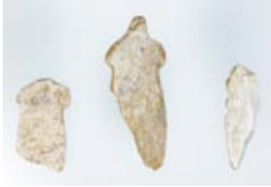
祭祀で使われた人形の形代

山(みたけさん)山頂の「大島御嶽山遺跡発掘調査」で、8世紀から9世紀を中心とした祭祀の遺跡の存在が明らかとなりました。そこからは、祭祀で使われた大量の遺物が発掘され、その内容がよく分かる成果が得られます。