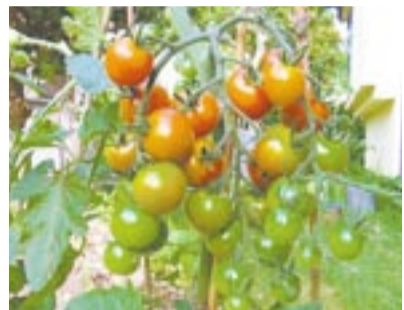
野菜も立派に育ちます

市では、市民サービス協働化提案制度で、「ゴミ問題を考える住民の連合会・宗像」と生ごみ堆肥化講座を開催。講座は、生ごみ処