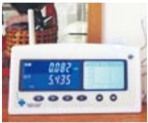
省エネナビ表示器

● 内容 家庭での節電を推進するため、電気使用量や、それによる二酸化炭素排出量などが把握できる「省エネナビ(家庭用電力使用量測定機器)」を市民のみなさんに無料で貸与。その結果を市へ報告する市民モニターを募集 ● 貸出期間 貸出決定から6カ月間 ● 募集数 先着10世帯 ● 申込締切日 5月17日(金) ● 申込先 環境課 ☎(36)1421