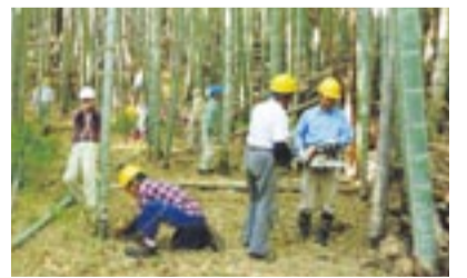
竹林伐採時の作業道を作っている様子

● 主催 NPO法人宗像里山の会 ● 日時 5月19日(日) 午前9時～正午 ● 場所 宗像メイトム宗像・202会議室 ● 実習 宗像ユリックス隣接竹林内 ● 内容 座学 演題「誰にでも取り組める竹林管理」竹を上手に育てることができれば、毎年おいしいタケノコが育ちます