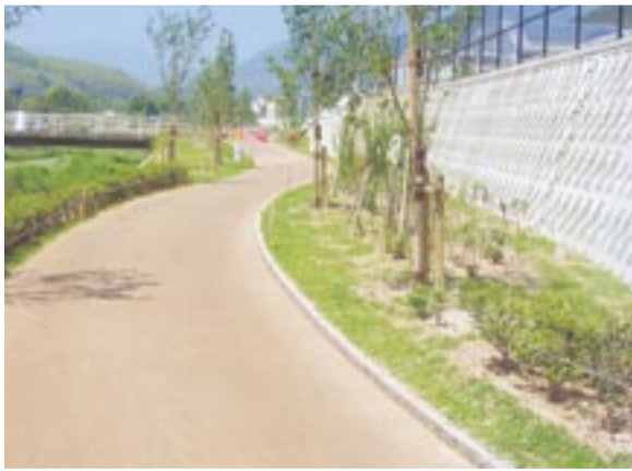
整備中のウォーキングロード「てくてく」