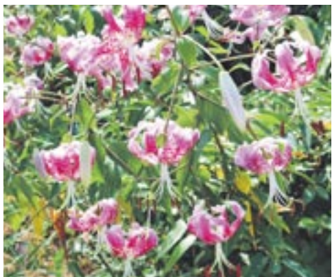
市の花「カノコユリ」

カノコユリは世界的希少種です。花びらにシカの子どもの背中のような柄があることから、「鹿の子ユリ（カノコユリ）」と名付けられました。カノコユリが自生している地域は、国内でも数カ所、その内の1カ所が宗像市です。そのため、この希少価値から、市の花に指定されました。平成21～23年に、九州大学園芸学ユニット宗像未来プロジェクトで、比良松道一助教授が実施した調査では、宗像固有系統のカノコユリが発見されました。開花時期は、7月中旬から8月上旬です。現在、正助ふるさと村では、球根を収穫して配布するために、平成23年度から、カノコユリを種