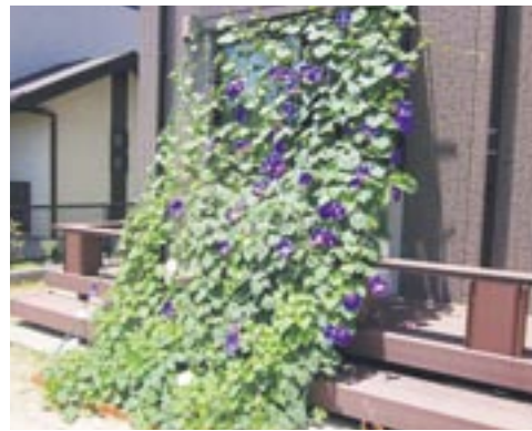
アサガオの「緑のカーテン」

緑のカーテンとは、日光が当たる建物や窓などの外に、ツル性植物（アサガオ、ヘチマ、ゴーヤなど）を、棚やネットを利用して育て、日差しをさえぎることで室内温度の上昇を防ぐ、見た目にも涼しい日差し対策です。