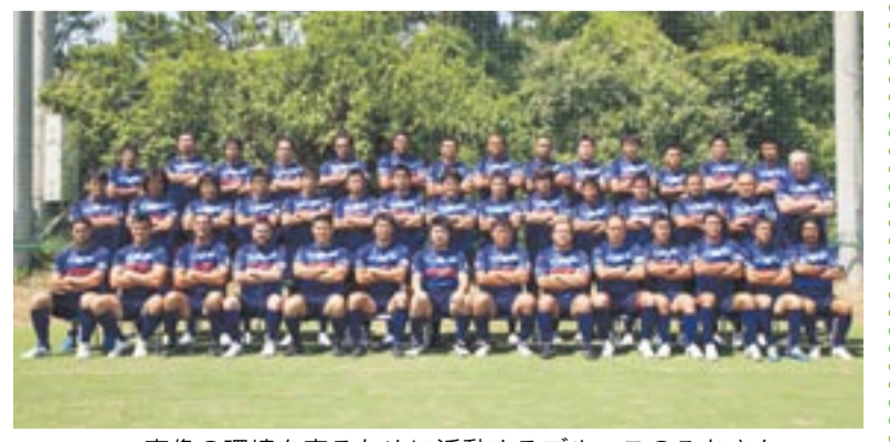
宗像の環境を守るために活動するブルースのみなさん

チームが担当している区画は、活動拠点の玄海グラウンドへの入口です。市外から来るファ