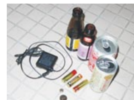
燃やすごみに入っていた不燃ごみ *燃やすごみとしては出せない不燃ごみも1.1%混入していました