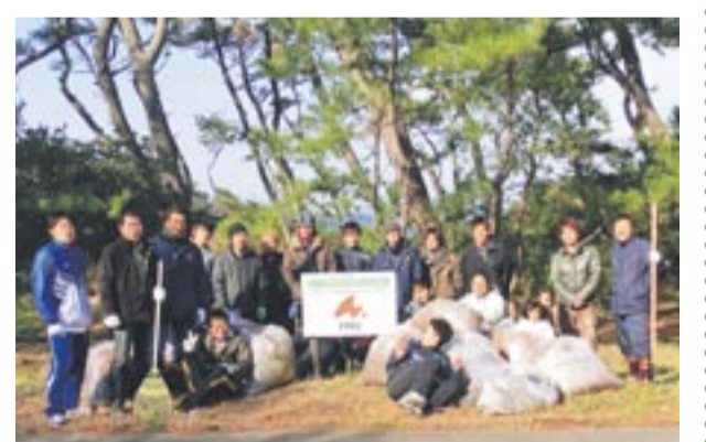
草刈りとごみ拾いで松原の美化に取り組んでいるTPECのみなさん