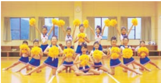
息もぴったり、笑顔でダンスを披露するメンバー

「自分も相手も元気になる」チアダンスのメンバーは、小学2年生から6年生までの14人で結成されたチーム「Rose Honey(ローズ・ハニー)」のメンバー。息もぴったり、楽しそうにダンスをする姿は、見ているだけで元気をもらうことができます。週2〜3回、1時間程度の限られた時間の中で練習に励み、昨年、チアダンス九州予選大会で見事優勝し、11月に千葉の幕