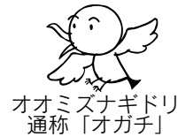
オオミズナギドリ 通称「オガチ」

毎年10月1日～同3日、「みあれ祭」に始まる宗像大社秋季大祭が開催されます。秋季大祭前の9月をオガチマンス(世界遺産強調月間)とし、「宗像・沖ノ島と関連遺産群」をPRするさまざまなイベントを実施します。「オガチ」は沖ノ島に生息する「オオミズナギドリ」の俗称です。