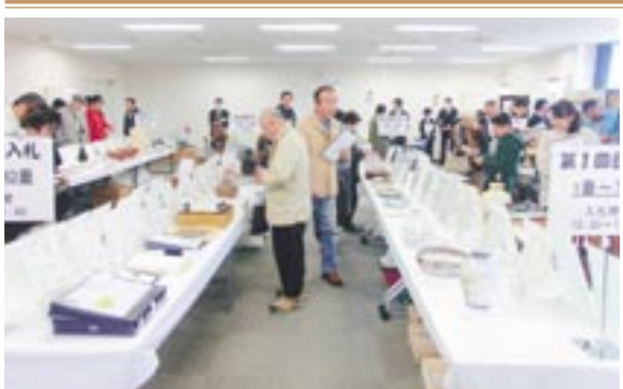
前回実施した公売会の様子

●公売の目的 差し押さえた動産の売却で市税などの滞納金額を減らす ●滞納すると、