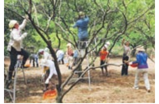
草刈りや古枝落としなどの作業をするオーナーのみなさん

大島果樹オーナーの第1回作業を7月15日、島内のみかん畑で実施。収穫への第1歩を踏み出しました。