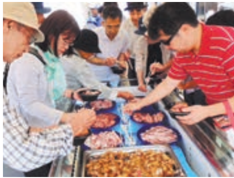
鮮魚のせ放題! 海鮮丼が大人気(昨年の様子)

宗像の各漁港で水揚げされた魚が同センターのいけすに集まります。周年祭で味わってください!