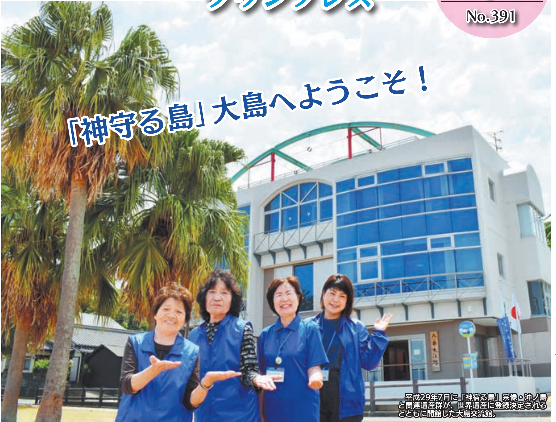
平成29年7月に「神宿る島」宗像・沖ノ島と関連遺産群が、世界遺産に登録決定されるとともに開館した大島交流館。