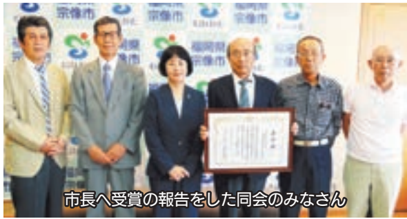
市長へ受賞の報告をした同会のみなさん