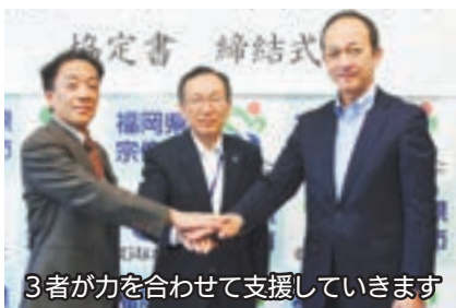
3者が力を合わせて支援していきます

福岡県弁護士会、日本司法支援センター（法テラス）と市の三者で6月24日、協定書を締結。法律相談事業「むなかたリーガルエイドプログラム」を開始しました。同事業では、生活保護受給者や生活困窮者らへ借金の整理や離婚、相続などの法律相談（毎月第2火曜日に4件まで）を、市役所内で弁護士が受け、法律問題の解決を支援していきます。