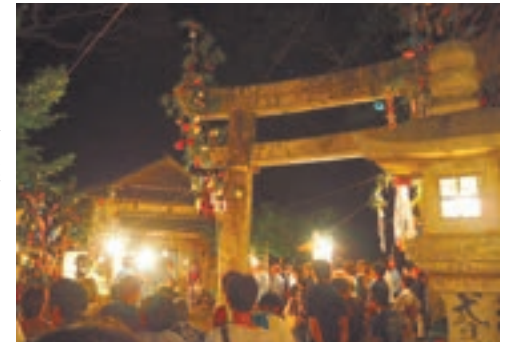
七夕飾りが幻想的な宗像大社中津宮

* 帰りの船のお知らせ＝まつり終了後、大島港ターミナル発(21:30ごろ)の渡船チャーター便(有料)を運航予定