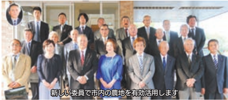
新しい委員で市内の農地を有効活用します

平成31年3月末の任期満了に伴い、市長から任命を受けた農業委員12人と、農業委員会会長から委嘱を受けた農地利用最適化推進委員12人が決定。本年度4月から農地法に基づく農地転用案件の審議や遊休農地の発生防止・解消などの活動を開始しています。