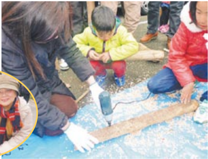
「ほだ木」にドリルで穴を開け駒打ち