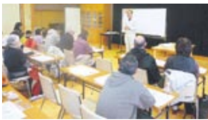
座学で、シイタケについて熱心に学ぶ参加者

昼食は、弁当の他、大島のシイタケが入った温かい汁に舌鼓。午後から、いよいよ実技です。インストラクターの指導で、「ほだ木」に電気ドリルで穴を開け、小づちなどで種駒(種菌)を打ち込