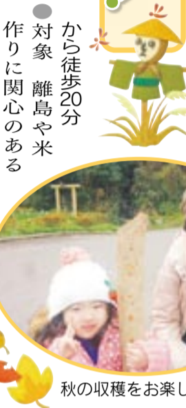
秋の収穫をお楽しみに!