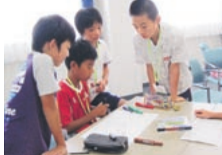
企画会議中の子ども実行委員(昨年の様子)

子どもまつりを一緒に盛り上げる参加団体募集 ●対象 次のいずれかに該当する団体 ▽18歳未満の子どもの主体となるグループ ▽青少年育成や子育て支援に携わる団体 ▽無料の体験活動を提供したい団体 *詳細は問い合わせを ●申込締切日 5月30日(金) ●申込・問い合わせ先 子どもまつり事務局(子ども育成課内) ☎(36)1214