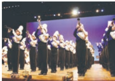
精華女子高校吹奏楽部