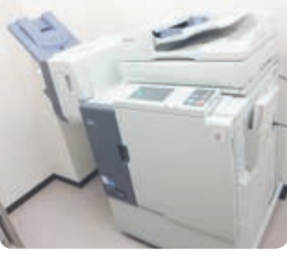
助成金で購入したカラー印刷機

自由ヶ丘地区コミュニティ運営協議会では、宝くじの助成金を活用し、カラー印刷機を購入しました。この宝くじ助成金は、財団法人自治総合センターの一般コミュニティ助成事業によるもので、宝くじの受託事業収入を財源にして、地域活動の健全な発展を目的に実施されています。