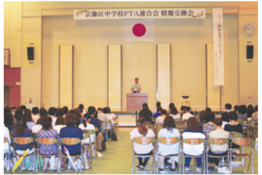
大勢の保護者も参加しました