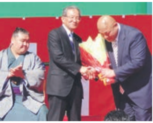
藤島部屋の活躍を祈念して親方と固い握手

広報紙15日号で毎月、市HP http://www.city.munakata.lg.jp/ に掲載している市長ブログを紹介しています。 問い合わせ先 秘書政策課秘書担当 ☎(36)0890