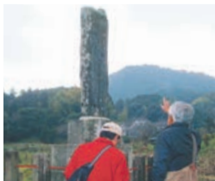
立派な中津文庭の石碑を見上げます

に出ました。ここを渡って300mほど先に「このみ公園」があります。オプショナルルート「許斐山登山コース」の出発点・登山口です。