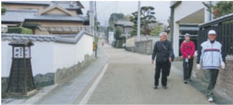
原町を歩けば昔の宗像を感じられる

みなさんもぜひ、南郷を歩いてみてください。ウォーキングマップは、市健康課や南郷コミセンなどで入手できます。（市民記者・真嶋賢一）