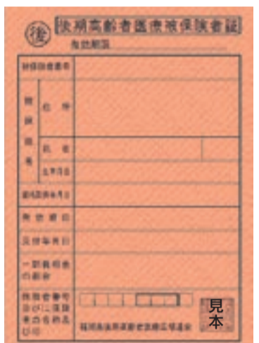
8月1日（土）以降に病院で受診するときは、この柿色の被保険者証を医療機関の窓口で提示してください

ただし、要件によっては、申請することで、1割の負担割合となります（該当者には市から申請書を郵送しています）。詳細は、被保険者証送付時に同封のパンフレットで確認してください。