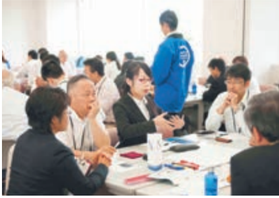
大学生も熱く議論

5月22、24日、宗像国際環境100人会議が開催されました。 同会議には約300人もの人々が、市外だけでなく国外からも参加。多くの人が宗像を訪れてくれました。第2回の今回は、環境ボランティアが駅で出迎え、会場では通訳ボランティアが案内するなど、地域の