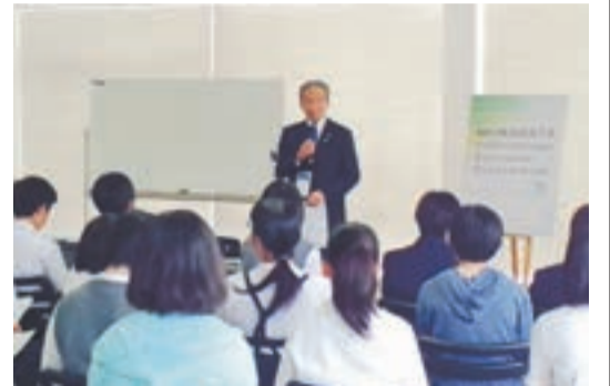
次世代を担う中学生と共に地球環境について真剣に考えました