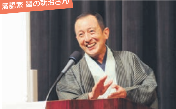
引き込まれる話し方で人権について語ってくれました

同和問題啓発強調月間の取り組みの一つとして7月17日、宗像ユリックス・ハーモニーホールで人権講演会を開催しました。