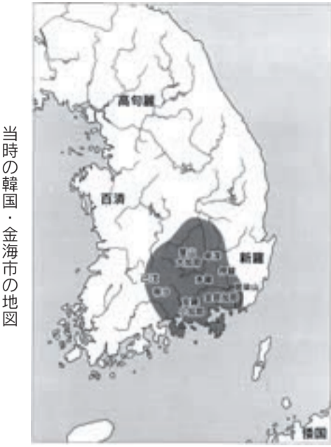
当時の韓国・金海市の地図

金海平野を南に臨む独立した丘陵上に立地します。古墳の数は、約100基あり、全体で見ると2世紀末〜7世紀にわたって営まれました。その中心は、39基の木槨墓(地面に穴を掘り、そこに木棺を埋葬した墳墓)であり、3〜5世紀に営まれました。