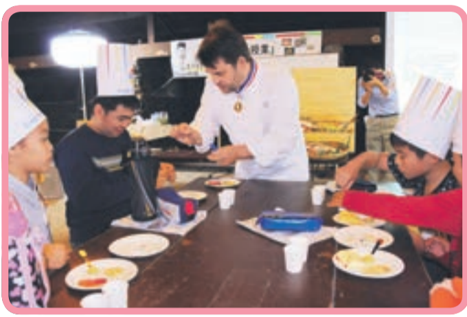
実際に食べてみて味の基本を実感しました

みなさんは、どんな味が好きですか？ 食事はよく味わって食べていますか？ 私たちには「味覚・嗅覚・視覚・聴覚・触覚」という、すばらしい5つの感覚が備わっています。これらの五感をよく働かせて食べると、食べ物がよりおいしく感じられ、食べる楽しみが広がります。