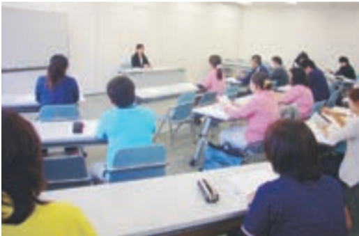
生活部会研修会の様子