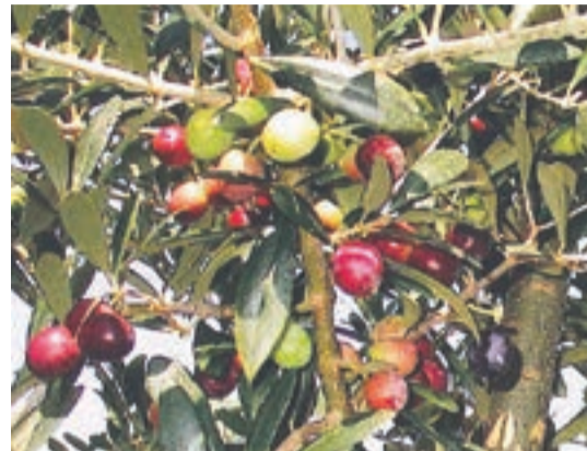
宗像産オリーブが育つのが楽しみです

農地耕作放棄地、遊休農地を解消するため、平成26年3月の広報で、オリーブに関する心がある人で、「宗像オリーブ」里山づくりがしたい研究会を募集し、宗像オリーブクラブ協議会を設立しました。 オリーブ栽培は農地耕作放棄地、遊休農地の有効利用はもとより、地域づくりの活動に活用できる作物でもあります。また、オリーブにはオレイン酸が豊富に含まれていることから生活習慣病の予防や健康づくりに期待できます。