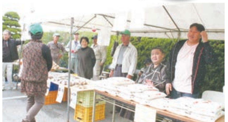
大繁盛だった農業まつりでの出店ブース

昨年11月21日〜同22日、JA本店で開催された「農業まつり」に農業委員会も出店。委員のみなさんが心をこめて作った新鮮な農作物を、安い価格で直接販売し、午前中ほとんど完売することができました。 その短い時間に、多くの人と接し、農政・農事に関する談話が弾み、意義ある活動になりました。 (桑野通孝広報部長)