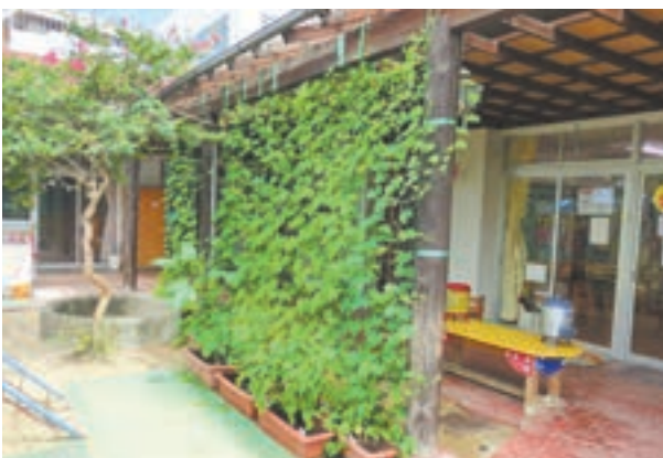
赤間保育園のゴーヤの緑のカーテン

緑のカーテンとは、日光が当たる建物の窓などの外にアサガオやヘチマ、ゴーヤなどのツル性植物を、ネットなどを利用して育て、日差しを遮ることで室内温度の上昇を防ぐ方法です。