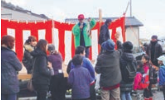
束の間の晴れ間で実施したステージイベント

出店テントでは、地島特産のワカメや椿油、その他多くの海産物などを販売。たくさんのお土産を手に、来島者は島を後にしました。