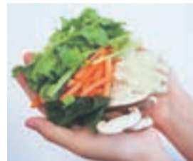
1日の目安量は両手のひら3杯分です

肥満の人ほど、糖尿病にかかりやすいことが分かっています。主食(炭水化物)、主菜(たんぱく質・脂質)、副菜(野菜など)をそろえたバランスのよい食事、標準体重(身長×身長×22)を保