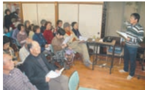
熱心に撫中先生の話聞く参加者のみなさん

「地域に密着し、普段から健康相談が受けられるかかりつけ医として、地域医療に取り組み、区民のみなさんの力になりたい」と話す撫中先生。お互いの顔が見える「地域づくり、地域医療」を身近に