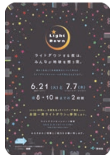
こちらのポスターが目印です

に思いをはせてみませんか。暗くなる時間帯は、防犯などに気をつけてください。 ■問い合わせ先 環境課 ☎(36)1421