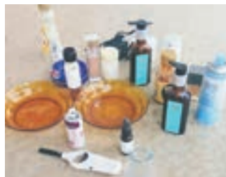
燃やすごみに入っていた不燃ごみ

市では、ごみ減量対策の基礎資料とするため、家庭から出された燃やすごみのごみ袋400袋の中身を分析する「組成調査」を2月に実施しました。