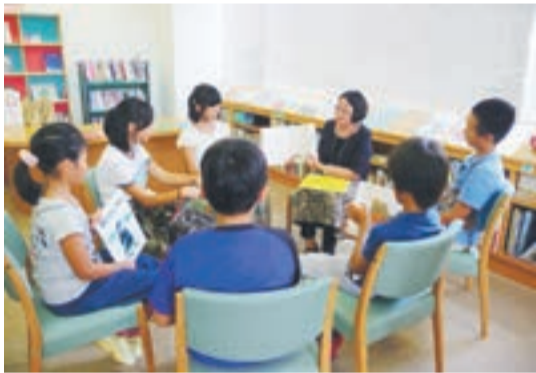
講座で絵本の読み聞かせの方法を学ぶ小学生

市では、平成24年度から「小学生読書リーダー養成講座」を開催しています。毎年、市内各小学校の図書委員会の児童から希望者を募り、2日間にわたって図書館の仕事の役割や、読書の楽しさ、大切さなどを学んでもらいます。今年7月25日と8月3日に、宗像ユリックス図書館とメイトム宗像を会場に開催し、33人の児童が参加しました。