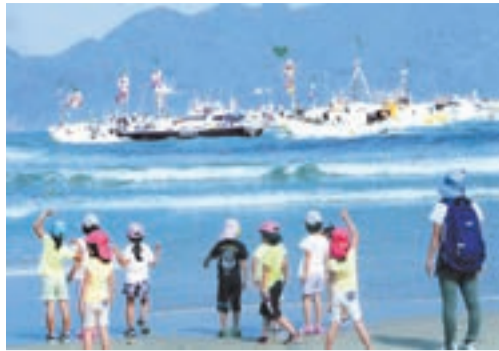
昨年の入選作品「御神体をお迎えする園児」

世界遺産登録を目指す「神宿る島」宗像・沖ノ島と関連遺産群。受け継がれてきた歴史とこれらを含み込む美しい暮らしの風景を、私たちは後世へと守り、