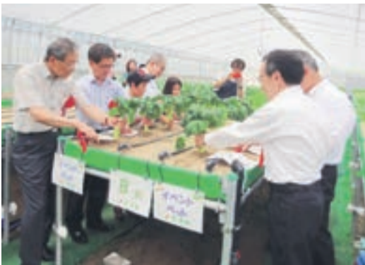
日の里ファームで収穫体験