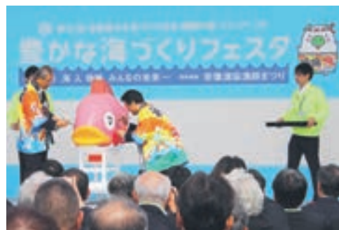
タイのマスコットに目を入れる 谷井博美市長と小川洋興知事

平成29年10月28日(土)、同29日(日)に開催される「第37回全国豊かな海づくり大会福岡大会」に向けて大会福岡大会」に向けて機運を盛り上げるため、プ