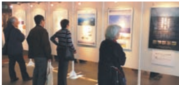
昨年も多くの人でにぎわいました

●同時開催 ▽2月11日(土・祝)、同日12日(日)の午前10時〜午後4時 本遺産群に関するクイズ *各日先着500人に参加賞あり ▽2月19日(日)まで 本遺産群に関するフォトコンテスト入賞作品の写真展 ●問い合わせ先 世界遺産登録推進室 ☎(36)9456