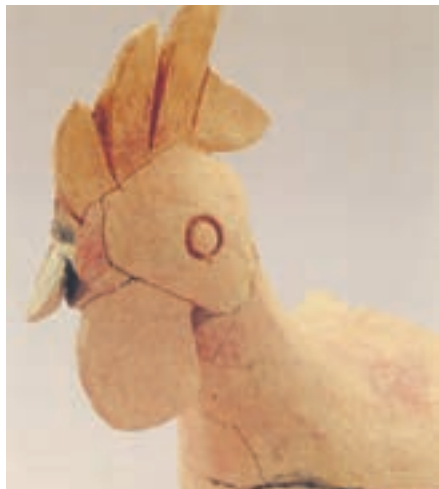
小郡市津古・生掛古墳出土鶏形土器

人々の生活で担っていたのでしょうか？ このことを考えてみると、鶏の習性を思い出し、みてください。「暁の空はさわやかに鶏鳴高く明け染めて」これは私の出身校の校歌の一部ですが、この歌詞の通り、鶏は明朝に鳴きます。 鶏は朝を告げる鳥、言い換えれば新しい首長が誕生したことを告げる鳥として(時を告げる神聖な鳥として)、古墳時代では古墳での祭祀(さいし)儀礼などで使われていたようです。実際、鶏の形を模した