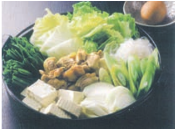
宗像名物・鶏のすき焼き