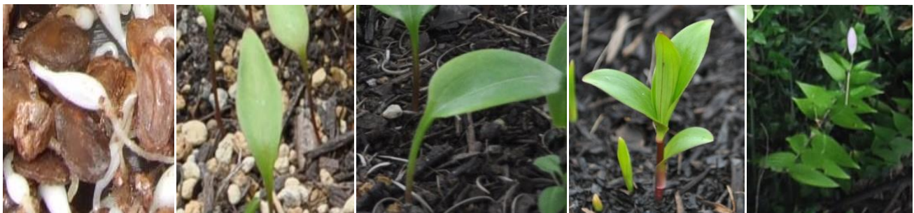
1年目 ⇨ 2年目 ⇨ 3年目 ⇨ 4年目 ⇨ 5年目

カノコユリの実生繁殖には、いくつかの方法がありますが、宗像固有種の実生繁殖は大量生産が可能な実生繁殖を行っています。しかし、実生では開花までに長期間を要し5年目でやっと開花しますが、昨年からは固有種の実生カノコユリが開花始めました。