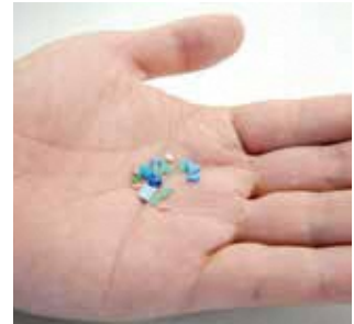
鐘崎の砂浜で採取した マイクロプラスチック