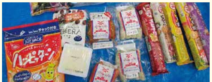
燃やすごみの中に捨てられていた食品の例