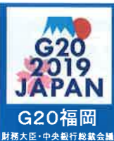
G20福岡 財務大臣・中央銀行総裁会議

問い合わせ 福岡県警察本部G20サミット対策課 【電話】 ☎092-641-4141 【HP】 http://www.police.pref.fukuoka.jp/keibi/g20/summit_top.html