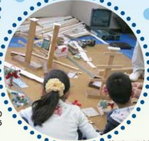
捨てちゃう木材を 工作してリサイクル