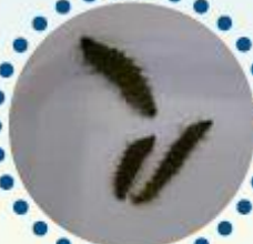
顕微鏡でホテルの 幼虫を見てみよう