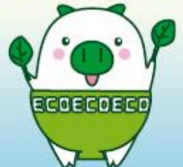
福岡県マスコットキャラクター