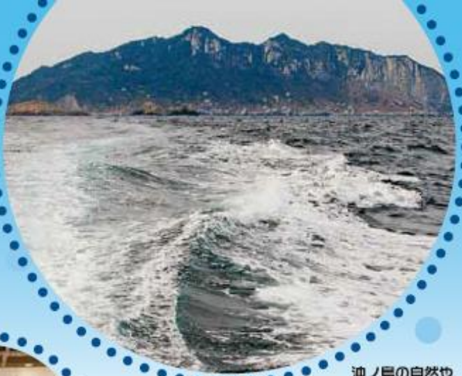
沖ノ島の自然や 蝶の写真を展示