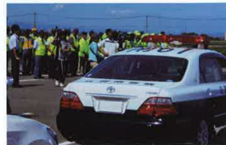
合同出発式 県境の佐賀南署との連携