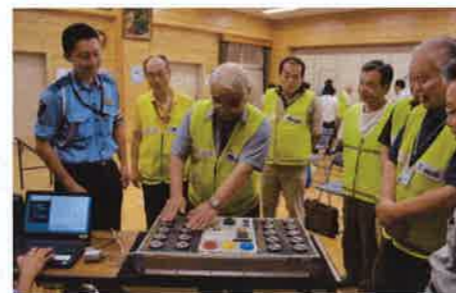
高齢者交通安全教室 自分の運動能力を知ること大切