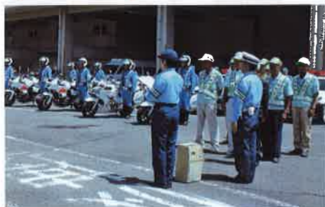
出発式 夏の交通安全県民運動のスタート