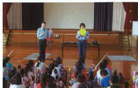
交通安全教室（光貞小学校） 暑いけどみんな真剣です