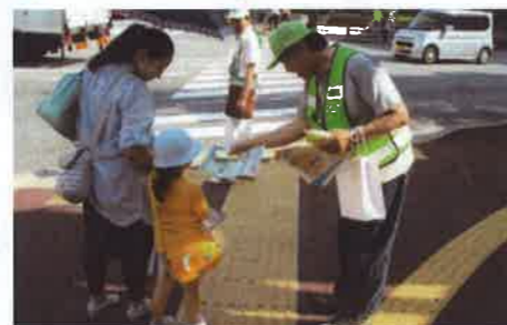
街頭キャンペーン 一人でも横断歩道を渡れるかな？