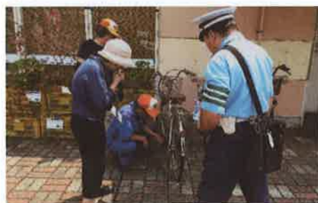
二輪・自転車の街頭整備点検 悪いところはないかしら…