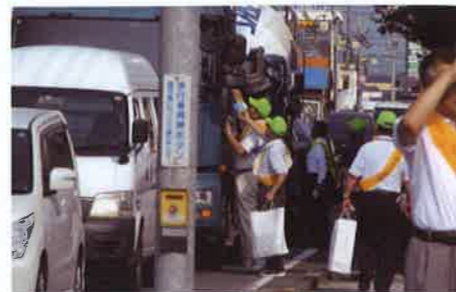
街頭キャンペーン プロドライバーにも安全運転をお願い