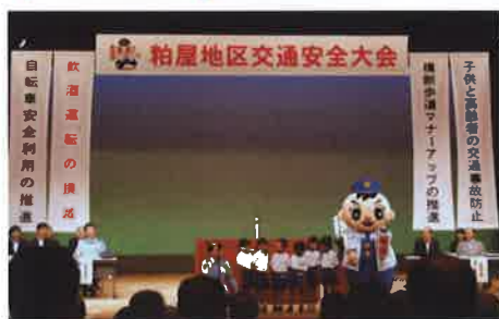
交通安全大会 会場に響き渡りました！園児たちの交通安全宣言