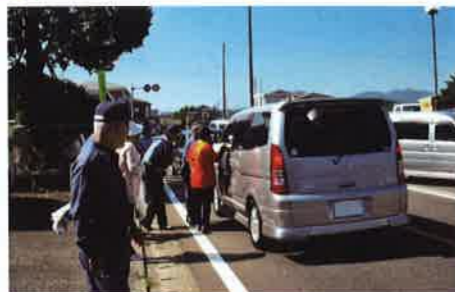
セーフティステーション 婦人会の皆さんも応援に