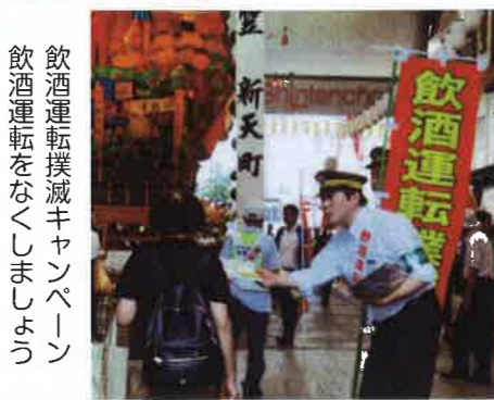
飲酒運転撲滅キャンペーン 飲酒運転をなくしましょう