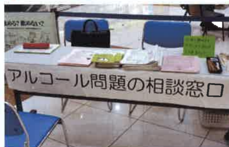
飲酒運転撲滅キャンペーン 保健所と連携して相談窓口を開設