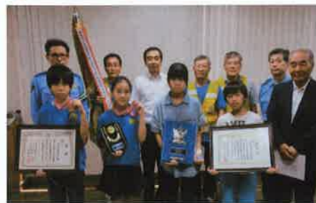
警察署への表敬訪問（小竹北小学校） 輝かしい実績を携えて…