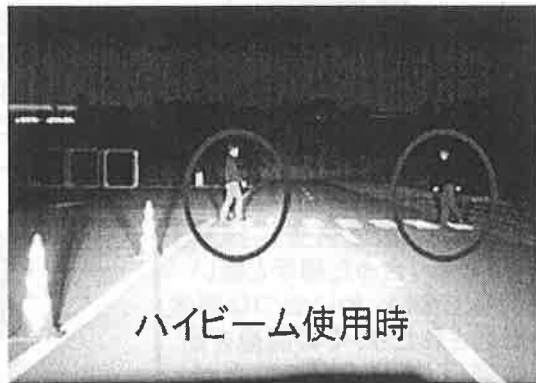
ハイビーム使用時