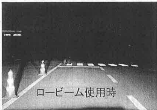
ロービーム使用時