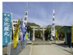
織幡神社春季大祭