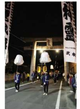
参道を進む御神幸行列

吉武地区の八所宮の御神幸祭は、神社と地域の人々が一体となって里の恵みに感謝し五穀豊穡を祈る祭りであり、その周辺に広がる田園風景と農村集落のまちなみが一体となったこの地域独自の歴史的風致を形成している。