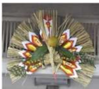
年中飾られる注連縄

これらの地域では日々の暮らしの中に豊漁と航海安全を祈り、感謝を捧げる様々な神々がいて、その信仰や風習が今も息づいている。