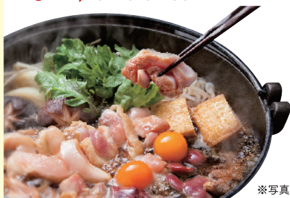
※写真は完成イメージです