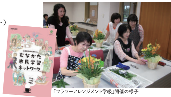
「フラワーアレンジメント学級」開催の様子

自分たちのやりたい学習を自らが指導者となって相互に学習できるように市民の中から指導者を発掘し、指導者と学びたい人をつなぎます。