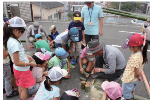
地域の有志ボランティアによる竹細工体験の様子