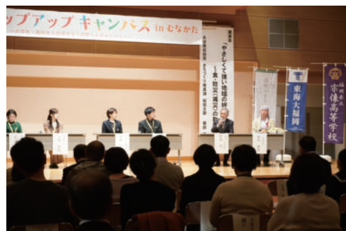
「ポップアップキャンパスinむなかた～大学生・高校生と交流する1日限りのキャンパス!～」開催の様子(令和元年12月)

市内2大学・2高校が協働し、それぞれがもつ知的資源や専門性を活かし、相互交流や学びの場を創り出しています。