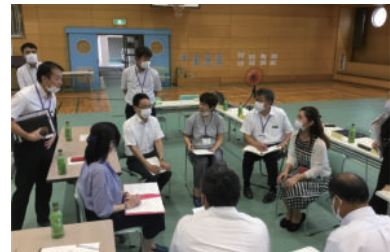
令和2年度中央学園運営協議会(第2回)の様子

学園(中学校区)と保護者、地域の皆さんとの対話の場を大切に、目的を共有し、協働で進める学校づくりを目指しています。