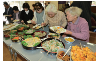
交流サロン開催の様子

高齢化率が40%を超えた吉武地区(令和2年9月末時点)では、地域での支え合いによる豊かな福祉づくりを目的に、福祉施設を活用したサロンなどを平成29年から開催しています。