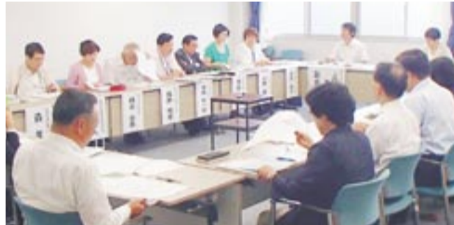
活発な意見が飛び交う協議会