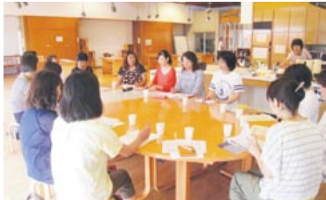
座談会で悩みを共有する参加者