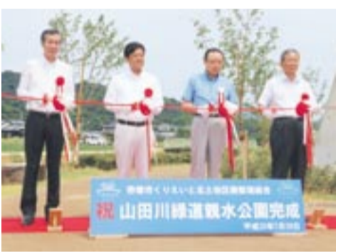
完成式典でテープカットを実施する関係者ら

山田川緑道親水公園「てくてく」の完成式典と記念行事を、くりえいと北土地区画整理事業地内で7月28日に実施し、来賓や多くの関係者が出席しました。