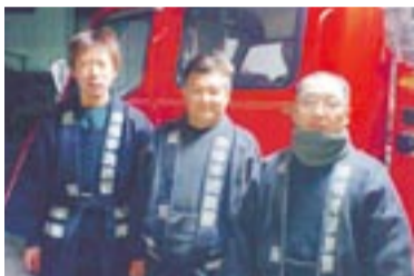
防災活動の一環として活動する消防団員

アダプト・プログラムとは、一定区間の公共の場(さつき松原を「養子(アダプト)」と見立て、年間を通して、市民とさつき松原管理運営協議会が協力して環境美化活動に取り組みする制度です。