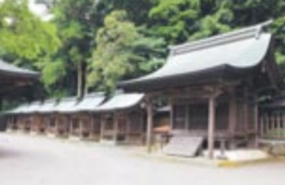
本殿の周りに並ぶ末社