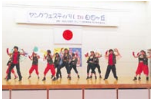
みんなで元気よくダンス

分の権利が尊重されるのと同様に、他の者の権利を尊重するよう努めなければならぬ(第8条)「良い悪い事及び社会のルールについてきちんと教えてもらうこと(第6条第4項)」が豊かに育つ権利として保障されています。