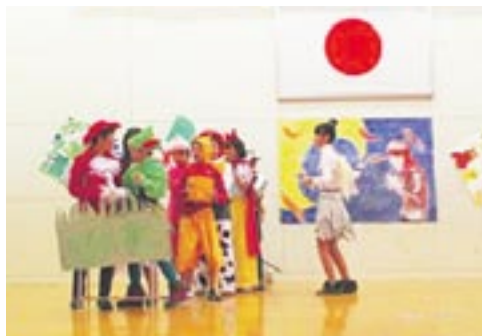
一生懸命練習した劇を披露