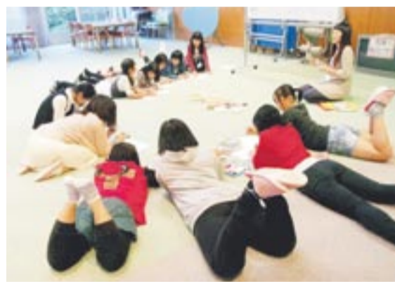
JAM(中高生の居場所)では、リラックスした雰囲気の中でさまざまな活動をしています

地域で活躍した子どもたちが大人になって、地域の子どもたちのために活躍する、まさに循環型の地域社会のモデルです。