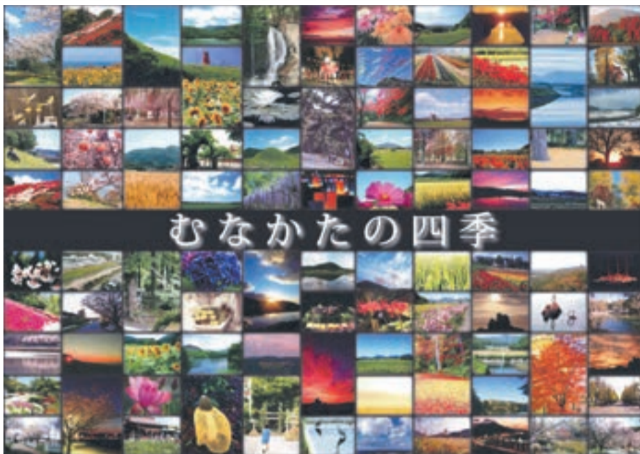
むなかた景観写真コンテスト写真展での展示パネル

これは、平成24年2月に開催した、むなかた景観写真コンテスト写真展の来場者の感想の一部です。同コンテストを通じて、本市の景観が人々にもたらす力の大きさを再認識することができました。いつの時代にも、このような力を感じてもらえるようなまちにしたいと考えています。市では、これまで受け継がれてきた本市の景観を、宝として、誇りとして、いつまでも大切に残していくために、景観計画と景観条例を策定・制定しました。