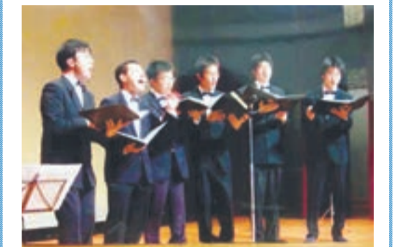
男性アンサンブルMENボウス

今回は、九州大学男声合唱団コールアカデミーのメンバーと、そのOBによるグループ「MENボウス」です。