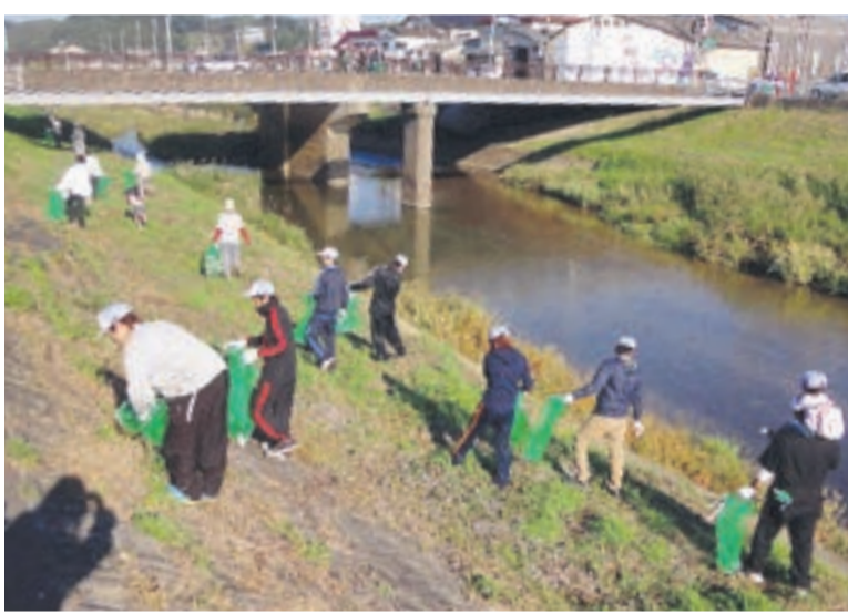
みなさんの協力でたくさんのごみを回収できました

ありがとうございました。釣川の水は、市民のみなさんの飲み水です。この命の水をいつまでもきれいに保つためには、みなさんに理解を深めてもらうことが大切です。