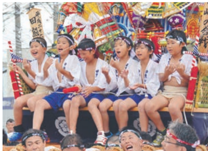
田熊山笠に元気いっぱい参加する子どもたち

東郷地区には、「田熊山笠」という夏の一大イベントがあります。その追い山の日の7月20日は、東郷小学校全校児童がイベントに参加しています。学年によって参加の仕方は違いますが、5・6年生は、先走りや台上がりを務めます。1学期の終業式の日を