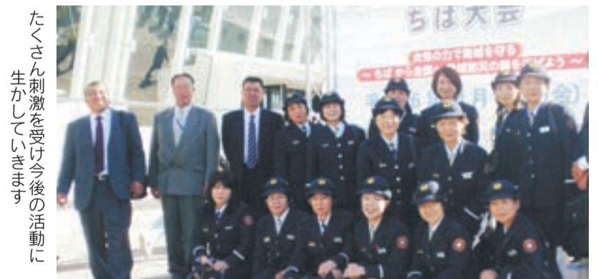
たくさん刺激を受け今後の活動に生かしていきます