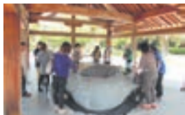
ガイドの説明を聞きながら境内を巡ります

●Aコース・宗像大社辺津宮境内(50分間) 本殿・拝殿、宗像三女神の降臨の地とされる高宮祭場を巡ります。 ▽出発時間=10:00~14:45の約30~45分おき ▽受付・集合=第一鳥居付近(祈願殿横) ●Bコース・神宝館(45分間) 宗像大社の古代から近代までの歴史を物語る宝物が展示されています。中でも、沖ノ島で出土した数々の国宝は必見です(入館料は自己負担)。 ▽出発時間=10:00~15:00の約30分おき ▽受付・集合=神宝館1階・受付カウンター ●A、Bコースの共通事項 ▽定員=各回先着15人 ▽集合時間=出発時間の5分前 *事前申込不要