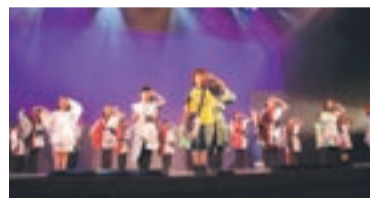
子どもたちが演じるミュージカルの様子

心の瞳で読む本を手にした男の子が、古代ムナカタにタイムスリップする物語。宗像の子どもたちの迫真の演技を、ぜひ見にきてください。