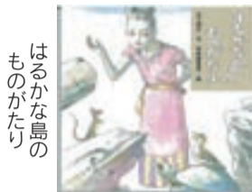
はるかな島のものがたり

沖ノ島を題材にした絵本のおはなし会です。大スクリーンに絵本を映し出しながら絵本を朗読します。 ●時間 15:15~15:35 ●会場 海の道むなかた館・3Dシアター *事前申込不要