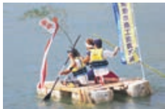
アイデアあふれるいかだで参加してください

●時間 ▽受付=13:00 ▽実施=14:00~16:00 ●会場 ▽集合=玄海小学校駐車場 ▽実施=釣川(玄海中学校前~さつき橋) ●参加要件 1チーム3~5人 *未就学児不可、小学生は保護者同伴 ●定員 先着30チーム ●申込締切日 8月14日(金) *いかだの制作・運搬費などは自己負担 *ライフジャケットの持参を。持っていない場合は有料で貸し出しあり。事前申込必要 *順延日は9月13日(日)10:30~12:30(受付は9:30~)