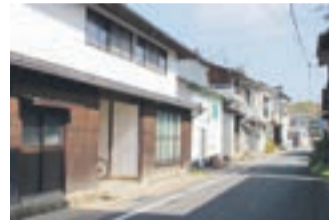
漁村の風景(大島地区の一部)