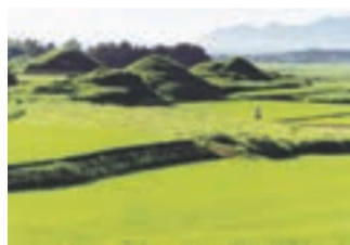
新原・奴山古墳群

かつて宗像地域や玄界灘の海域を支配し、優れた航海術を持ち、大陸との交流で活躍し、宗像の神を崇拝していた古代豪族・宗像氏の墳墓群です。