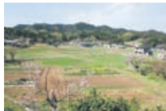
農村の風景(玄海地区の一部)

資産の価値を損なわないようにするため、資産周辺に設定するものを緩衝(かんしょう)地帯といいます。緩衝地帯は、景観計画、景観条例などで資産と周辺環境の保全に取り組んでいます。