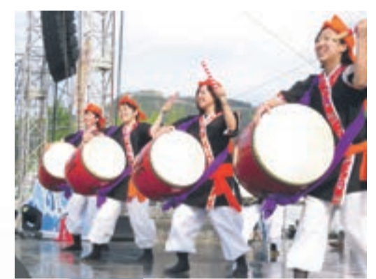
観客席からエールを送る市民訪問団のみなさん